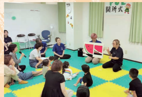
「ぐんぐんPOE(ポエ)」の開所式

令和7年には、更に実習の場を広げるべく、大阪府立守口支援学校の生徒を花博展示場にて受け入れるなど、障がいのある児童の自立と社会参加に向けた活動を積極的に行っております。